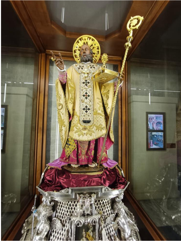
A to postać Świętego Mikołaja, która znajduje się w Bazylice jego imienia w Bari